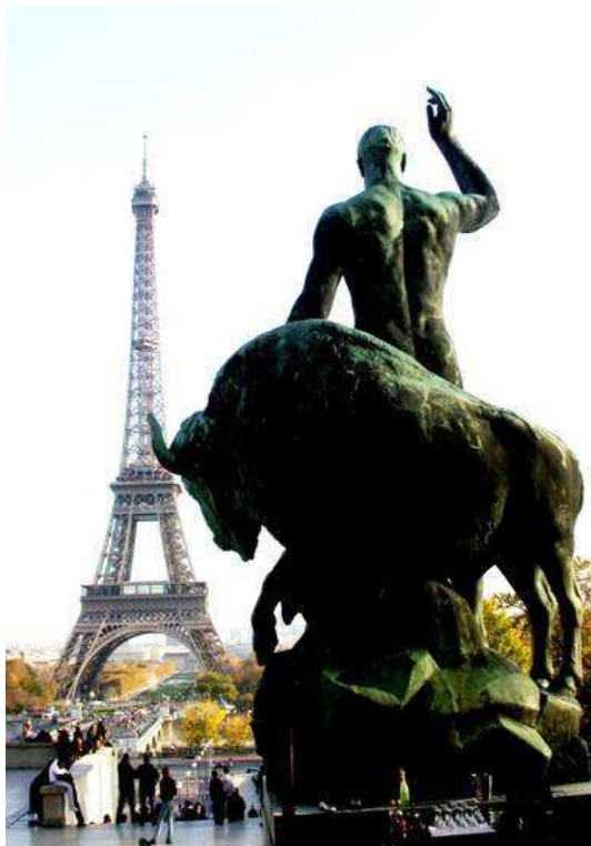
Vue de la Tour Eiffel depuis le musée de l'Homme. Statue d'Albert Pommier, Hercule domptant un bison, 1937

Come along with us on our innovative and customized visits around the capital and its surrounding area, where we comment in depth history and culture of the French nation.